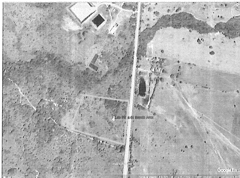
Figura 2. Imagen satelital del predio donde estará ubicada la planta de secado de arroz

El desarrollo del proyecto se realizará en el predio de propiedad del municipio de Paz de Ariporo con matrícula Inmobiliaria: 475-27958 y su localización exacta dentro del predio se deberá realizar conforme al documento Estudio de prefactibilidad para creación de una planta de secado de arroz en el municipio de Paz de Ariporo – Casanare, presentado por el municipio de Paz de Ariporo y que hace parte integral del presente proceso.